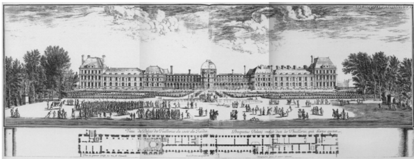
les Tuileries, emplacement du Concert spirituel (fin 17 e siècle)

Le Berger fidèle est composé en 1728, pour être gravée l'année suivante dans un premier recueil de Cantate à voix seule. L'auteur du livret n'est pas identifié.