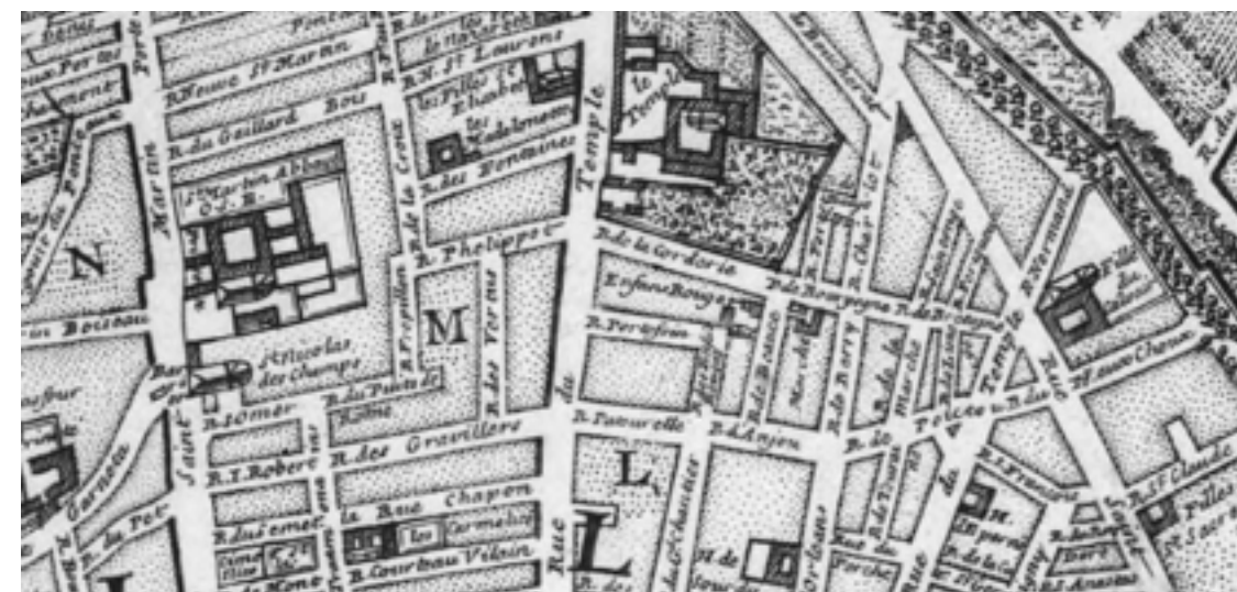
rue du Temple où réside Telemann (N. de Fer, plan de Paris, 1705)

Ayant acquis un privilège royal d'édition pour une durée de vingt ans, Telemann publiera de nombreuses œuvres durant cette période, au nombre desquelles son 71 e Psaume et les très célèbres Quatuors parisiens (TWV 43). Ces six « Nouveaux Quatuors » complètent l'édition des Six Quadri initialement parus à Hambourg en 1730 et constituent une sorte d'hommage à l'esthétique française. Ils furent interprétés au Concert Spirituel par Blavet, Guignon, Forqueray et Edouard, solistes de l'institution.